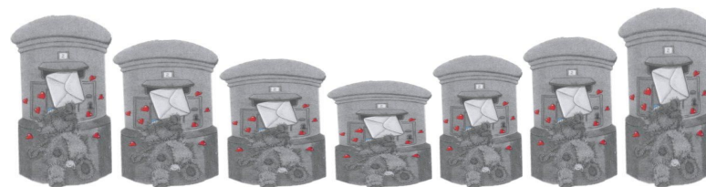
NOVÝ SPÔSOB VYJADROVANIA

Na záver chceme úprimne poďakovať všetkým prispievateľom do kráľovskej pošty. Sme potešení, že využívate netradičné spôsoby sprostredkovania Vašich nápadov. Povzbudzujeme Vás, len tak ďalej! Akýkoľvek spôsob je nám vítaný, pretože učí nás aj vás novému spôsobu vyjadrovania.